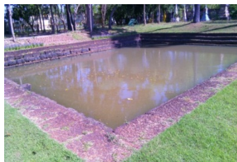
ภาพประกอบ 4 แสดงภาพสระน้ำ ก่อด้วยหินศิลาแลงเรียงกันเป็นชั้นๆ