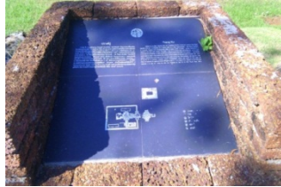
ภาพประกอบ 1 แสดงภาพลักษณะภูมิประเทศปราสาทแก้ว

ที่สร้างขึ้นในศิลปะเขมรปัจจุบันมีเพียงพระพุทธรูปที่สลักจากไม้ประดิษฐาน อยู่ภายในเป็นจำนวนหลายองค์เท่านั้น และจัดให้มี บุญประเพณีสงกรานต์ในวันเพ็ญเดือน 5 ของทุกปี (วิกิพีเดีย ออนไลน์, 2560)