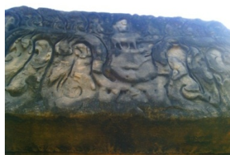
ภาพประกอบ 5 แสดงภาพพระอิศวรทรงโคอยู่ภายในซุ้มเหนือหน้ากาล