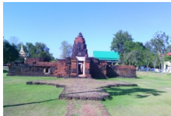
ภาพประกอบ 2 แสดงภาพปราสาทแก้วหรือประสาทรองแก้ว